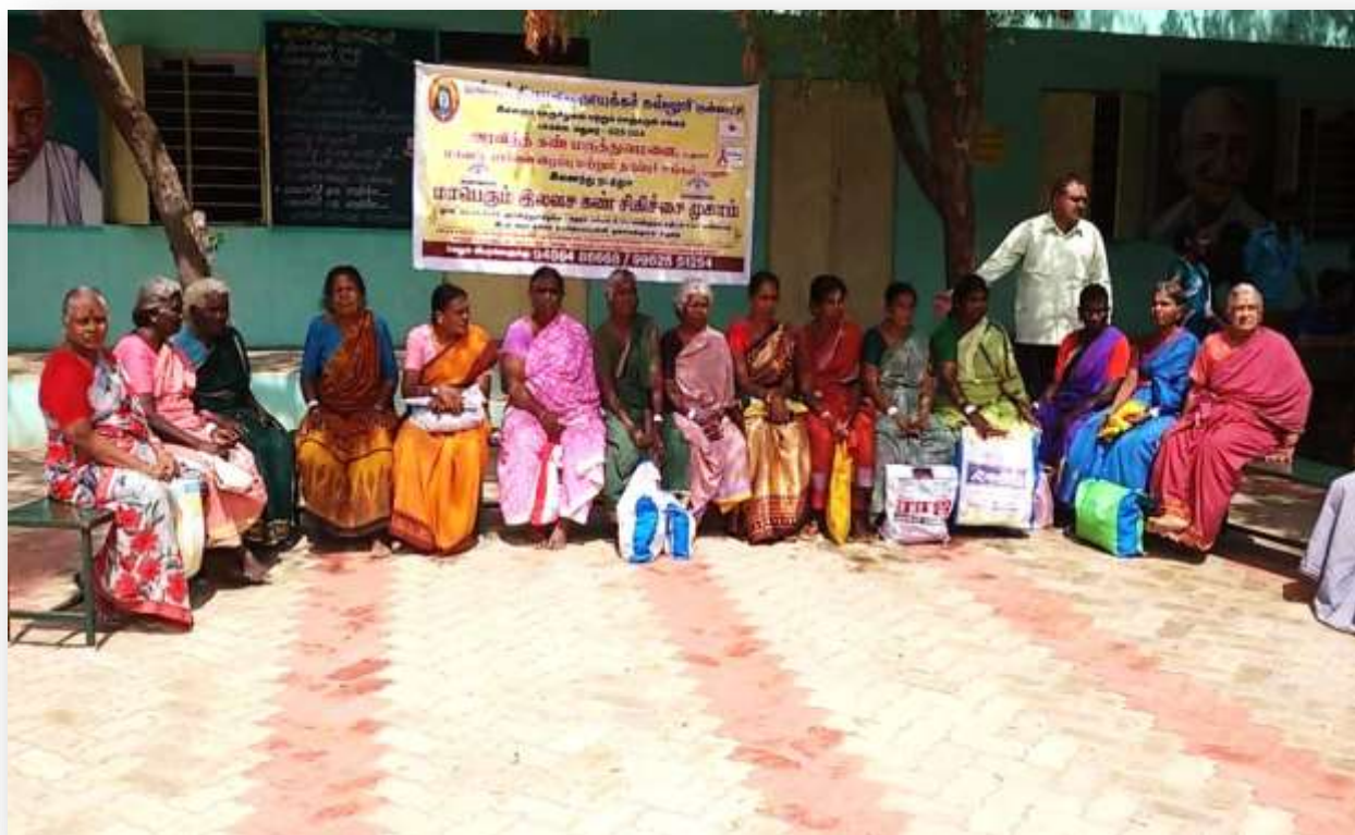
Beneficiaries screened for free cataract operation