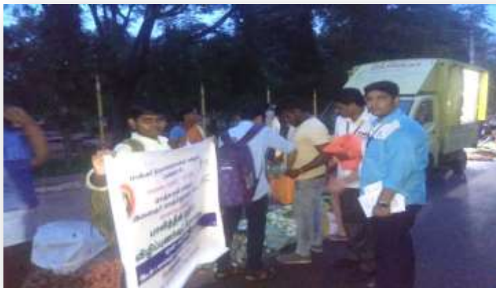
Volunteers involved in the campaign

Youth Red Cross and Red Ribbon Club of Mannar Thirumalai Naicker College jointly organized Awareness Campaign on Harmfulness of Plastic Usage at Thirunagar, near Friday Market. 300 cotton cloth bags were issued to people in order to create awareness on the harmful nature of plastic carry bags. 750 pamphlets were issued to the public. YRC and RRC Volunteers collected 200 plastic carry bags from public and disposed it safely as per the guidelines of the government.