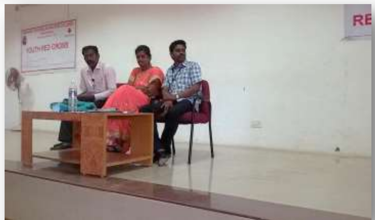
Dignitaries on the stage