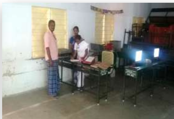
Honourable Secretary of the College at the Camp