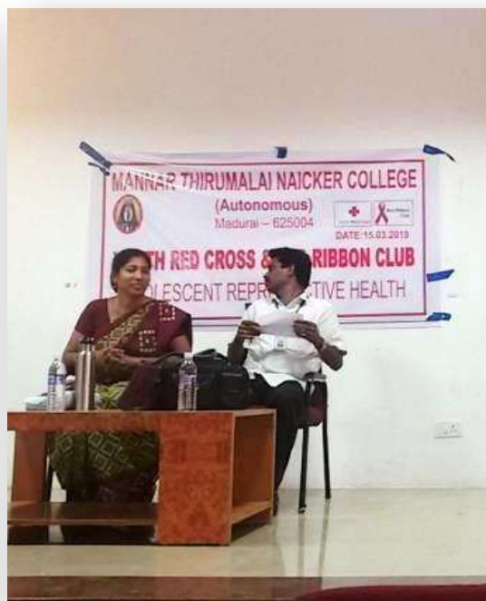
The Guest being honoured