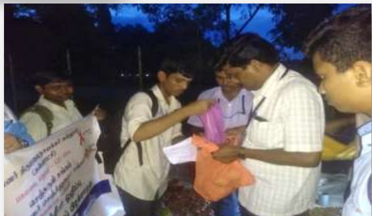
Volunteers collecting plastic bags from the public