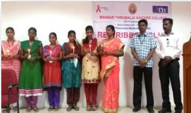
Chief Coordinators and Guest, and Student Volunteers at the Inauguration