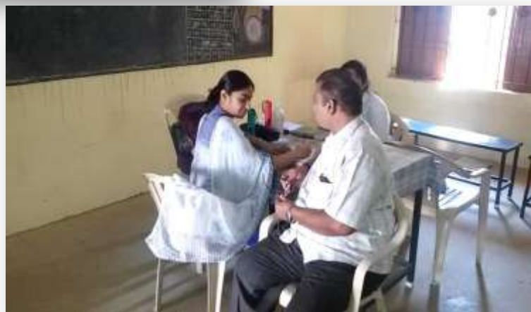
Public getting benefitted from the free camp